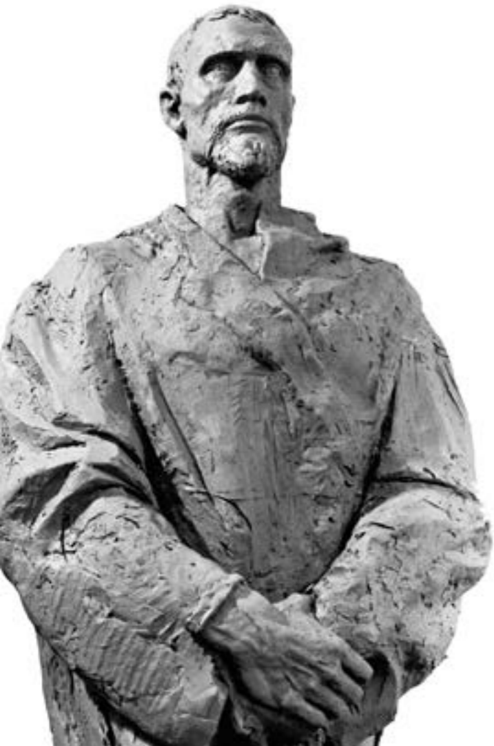
«За долю народную», 1966